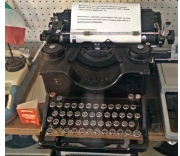
macchina da scrivere Olivetti, utilizzata da Bruno de Finetti