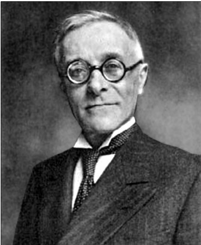
“Tullio Levi-Civita (1873 – 1941)”.