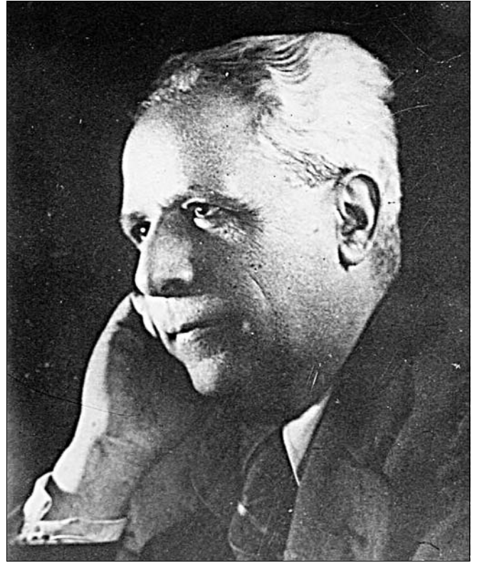
“Giulio Bemporad (1888 – 1945)”.