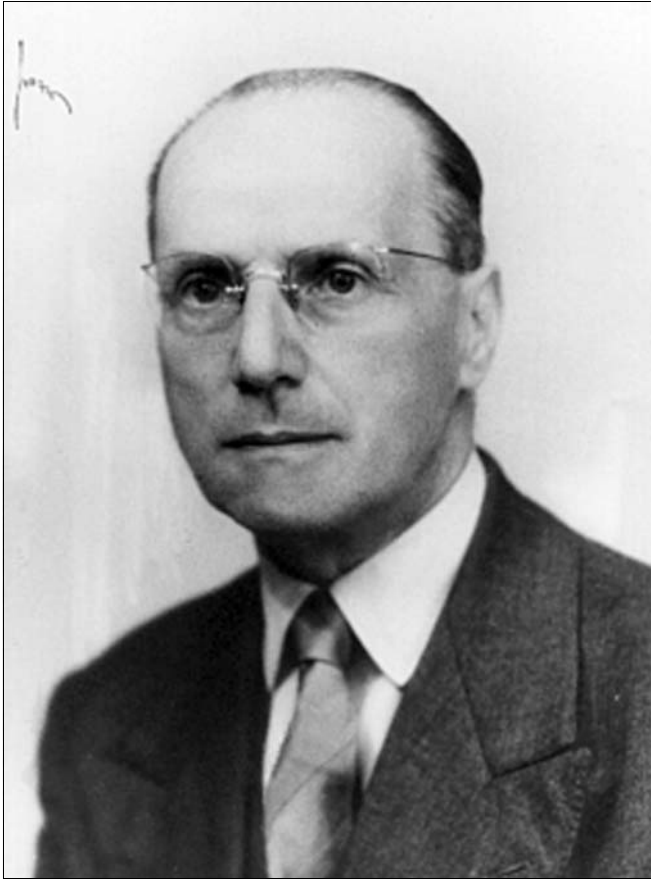
“Guido Ascoli (1887 – 1957)”.