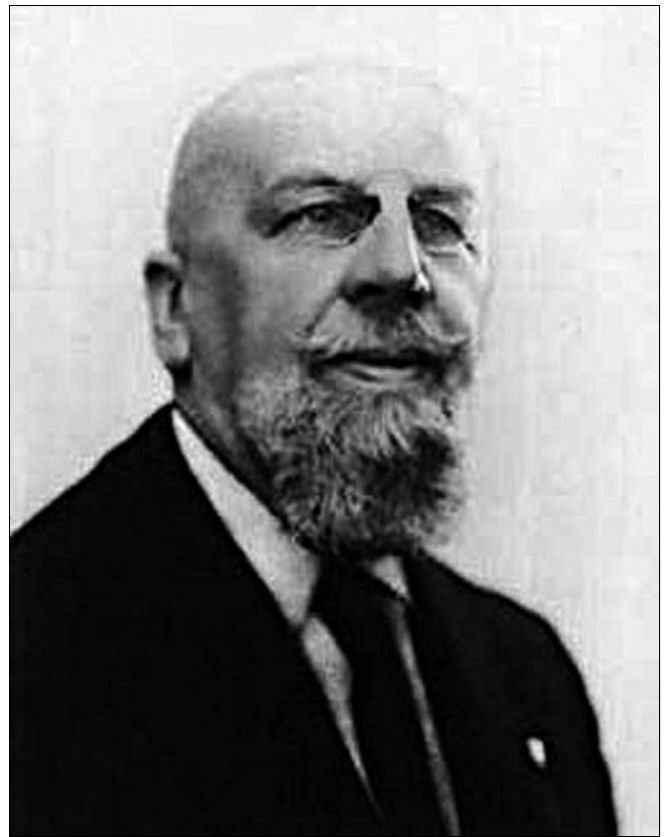
“Gino Fano (1871 – 1952)”.