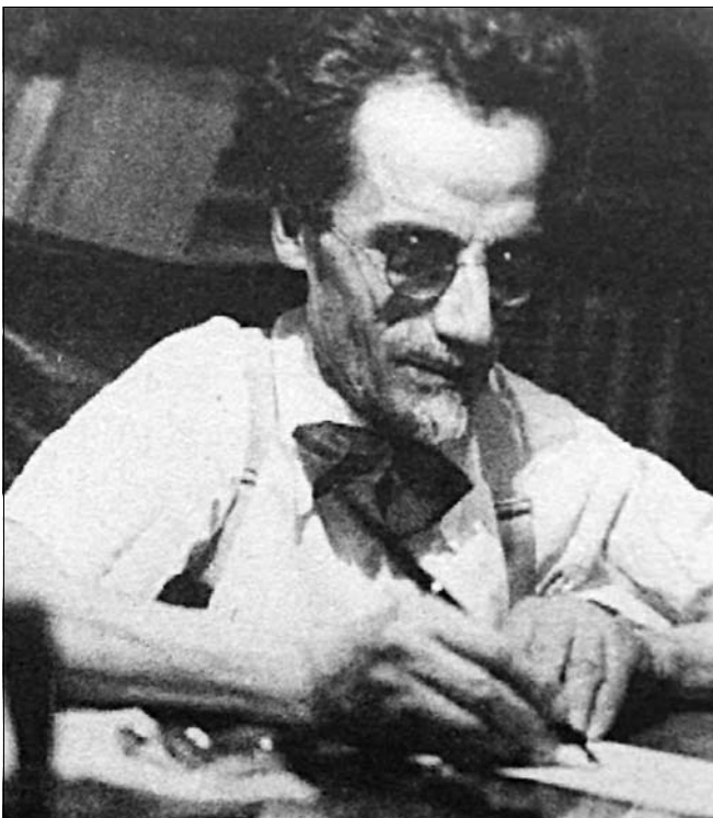
“Beppo Levi (1875 – 1961)”.