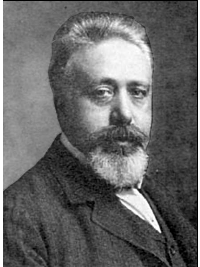
“Vito Volterra (1860 – 1940)”.