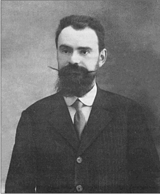
“Federigo Enriques (1871 – 1946)”.