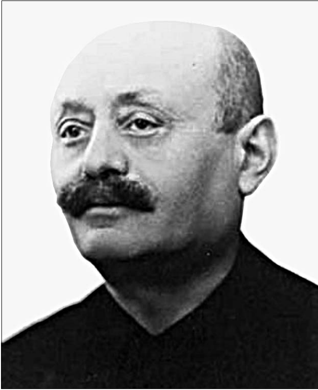
“Guido Fubini (1879 – 1943)”.