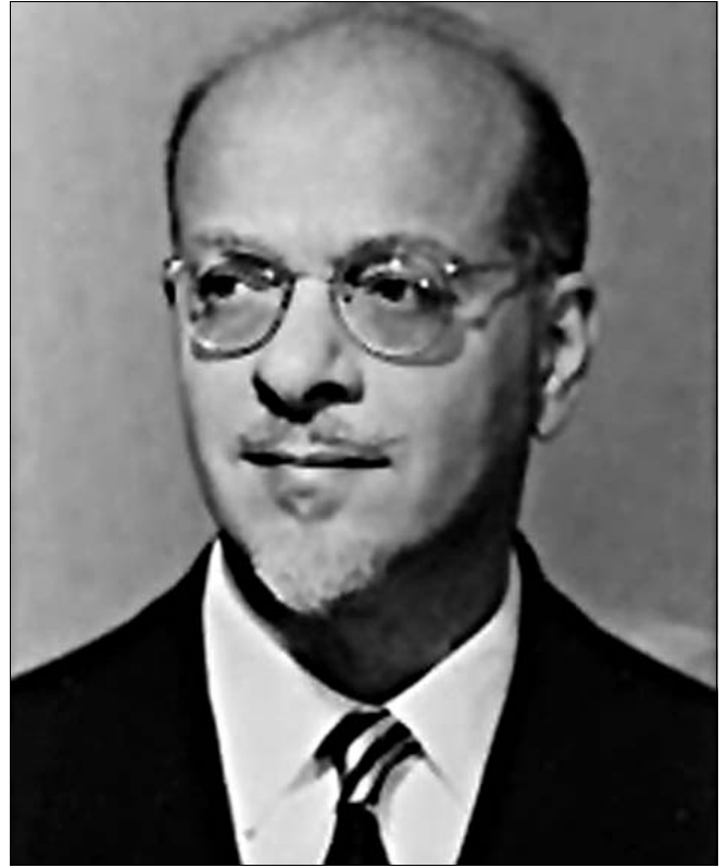
“Beniamino Segre (1903 – 1977)”.